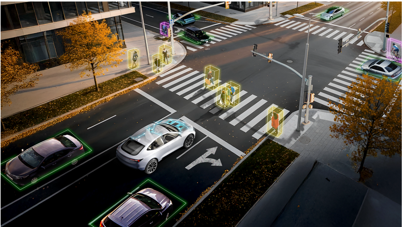
그림 1. 환경 데이터를 분석하는 소프트웨어 정의 차량의 자율 주행을 위한 ADAS 기능 시각화

자동차 업계는 중앙 컴퓨팅 플랫폼의 도움으로 차량 자율주행 수준을 한층 더 높이고 있습니다. TDA5 제품군과 같은 SoC는 통합 C7™ NPU 및 칩렛 지원 설계를 통해 안전하고 효율적인 AI 성능을 제공합니다. 이러한 SoC를 통해 자동차 제조업체는 ADAS 기능을 더욱 쉽게 구현하여 기본 모델에서 고급 자동차에 이르기까지 모든 유형의 차량에 프리미엄 기능을 제공합니다.