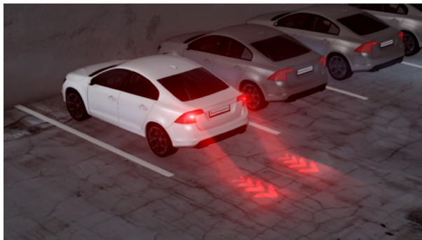
Abbildung 4. Ein Fahrer kann seinen beabsichtigten Fahrweg anzeigen, indem ein Pfad auf dem Boden hinter seinem Fahrzeug durch die Heckleuchten projiziert wird.

Verkehrsteilnehmer klar verständlich kommuniziert (Abbildung 4).