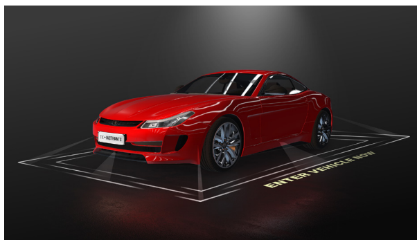
Abbildung 3. Lichtteppich für Fahrzeuge, der von mehreren Stellen im Fahrzeug aus projiziert wird.

Die Seitenspiegel können für die Beleuchtung eines Fahrzeugs gleich mehrere Funktionen erfüllen; zum einen können in den Seitenspiegeln Blinker eingesetzt werden und zum anderen können die Seitenspiegel genutzt werden, um einen Lichtteppich an den Seiten des Fahrzeugs zu erzeugen, der die gesamte Länge des Fahrzeugs umspannt ( Abbildung 3 ). Diese Art der Beleuchtung kann besonders dann hilfreich sein, wenn der Fahrer in einer schlecht beleuchteten Umgebung oder nachts ein- oder aussteigen möchte.