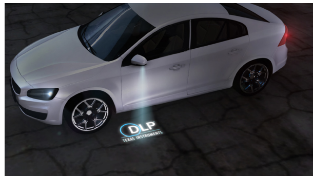
Abbildung 2. Kleine Außenbeleuchtung, die ein Logo vom Außenspiegel auf den Boden projiziert.

Mithilfe von DLP-Technik kann die Funktionalität von kleinen Außenleuchten am Fahrzeug erheblich erweitert werden, z. B. durch Integration in die Innenverkleidung der Tür, in den Trittleisten oder der Unterseite des Seitenspiegels ( Abbildung 2 ).