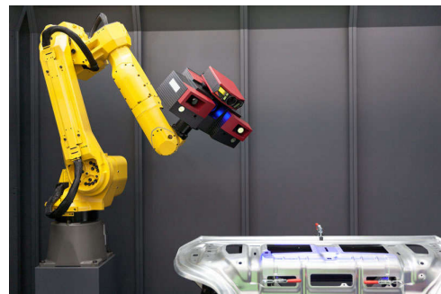
图 1. 安装在机械臂上的 3D 扫描仪