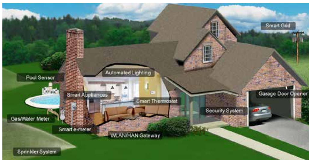
图 1. 应用物联网的住宅，其中的连接设备和电器以看不见的方式为消费者提供服务。

消费者已经连接了很多物品，例如恒温器、能量计、照明控制系统、音乐流式传输及控制系统、远程视频流媒体盒、泳池系统以及灌溉系统，将来还会连接更多物品。以上系统中大多数通过网站进行连接，因此，用户能够通过标准 Web 浏览器或智能手机应用程序（充当个人 NOC）管理它们。