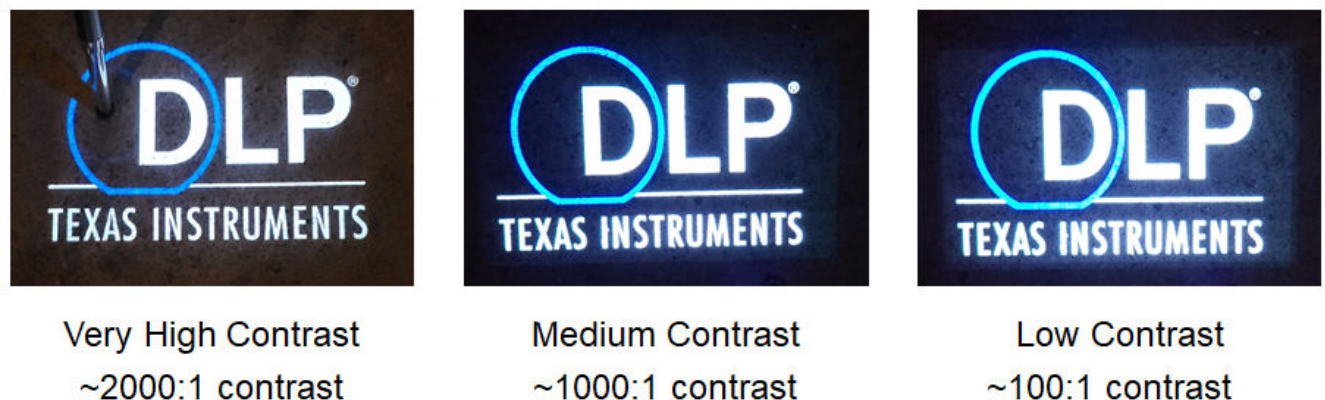
图 2-2. 具有不同对比度的 DGP 投影

投影仪 ( 或任何显示器 ) 的对比度是指全白图像与全黑图像的亮度之比。理想情况下, 显示器将具有无限的对比度, 这种情况下显示的任何黑色像素均不发光, 但实际情况并不是这样。如果显示的对比度太低, 则在图像的较暗部分看不到太多细节。对于在环境亮度较高的环境中具有低对比度的投影图像, 有时在图像周围会看到黑色边框, 从而会亮起灰色框, 或者在中心的明亮图像周围出现“明信片”效果。