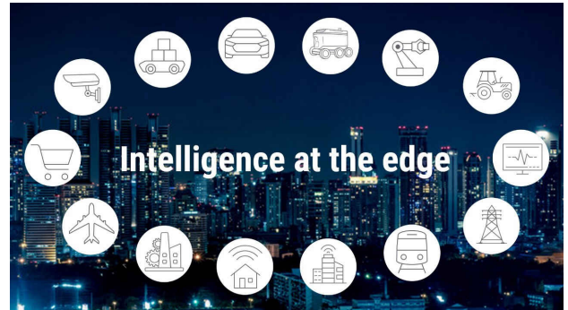
图 1. 边缘智能存在于许多不同的应用中

成本受限的环境下高效运行，边缘 AI 应用需要高速和低功耗处理，以及特定于应用和其任务的高级集成。图 1 展示了一些可使用边缘 AI 处理来提高性能和效率的应用。例如，使用视觉输入的边缘 AI 系统可以通过单个摄像头在生产线上实现质量控制，或通过多个摄像头帮助在汽车或移动机器人中实现功能安全。