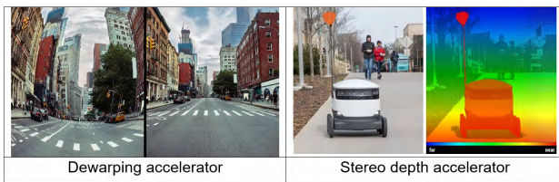
图 3. 视觉加速器功能

此类边缘 AI 处理器 SoC 可以在硬件上加速计算密集型低级别强力像素处理视觉任务，例如视觉处理加速器内核中的 ISP、镜头失真校正、多尺度缩放和双边噪声滤波。深度和运动感知加速器内核可以加速立体深度估算和密集光流，有助于增强对环境的感知，如图 3 所示。