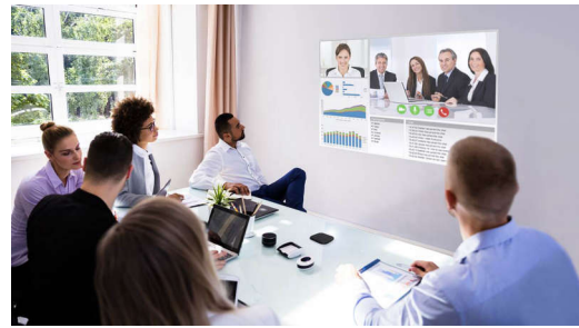
图 2. 采用 1080p 全高清 DLP® 技术的会议室显示器